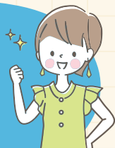
デイサービス職員

レクリエーションの時間を担当するのが楽しみになりました。今までは、なにかしなければならなくて憂鬱でしたが、今は、利用者みなさんの「楽しい」時間を創ることができて、自分自身も充実しています。