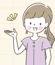
社会福祉協議会職員

対象者に寄り添ったコミュニケーションの取り方ができるようになったことで、指導の場面だけでなく、仲間との関係も良くなりました。